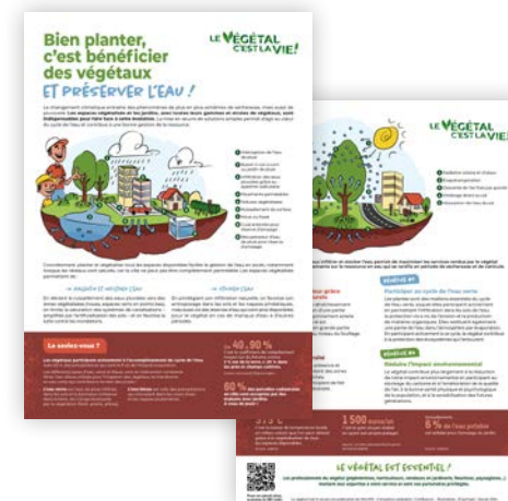
Fiche introductive Format A4 (21x29,7 cm)