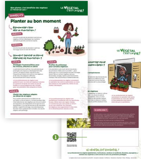
Fiche-Conseil 3 Format A4 (21x29,7 cm)